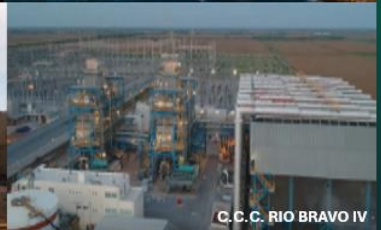
C.C.C. RIO BRAVO IV