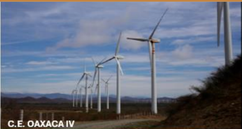
C.E. OAXACA IV