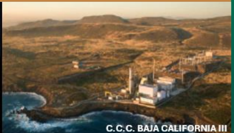
C.C.C. BAJA CALIFORNIA III