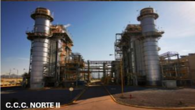
C.C.C. NORTE II